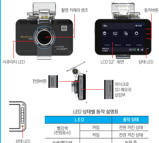
LED 상태별 동작 설명표